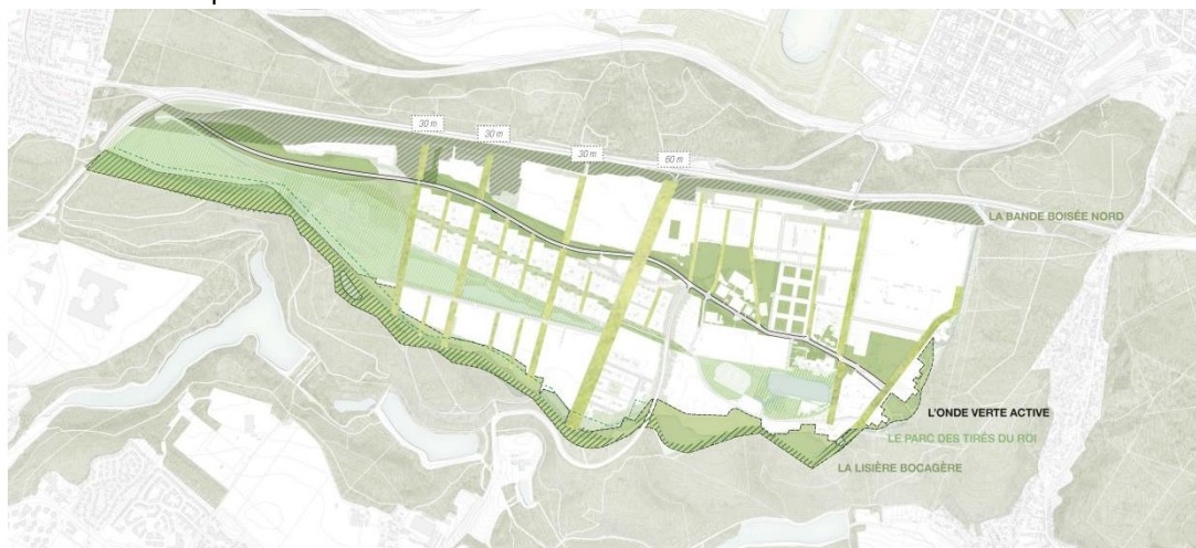
Les grands principes paysagers à l'échelle du plateau

Ces premières réflexions ont été reprises dans l'ensemble des études, tant techniques qu'urbaines. Elles sont au cœur du travail du groupement de maîtrise d'œuvre urbaine Pranlas-Descours Dalnoky Egis. Elles font partie de la structure paysagère Est-Ouest maillant l'ensemble du plateau. Le renforcement des lisières est prévu dès la première phase de réalisation de l'opération.