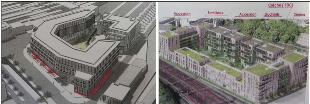
Ilôt Est : Bureaux et commerces